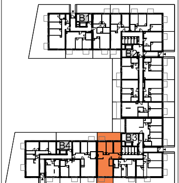
USYTUOWANIE MIESZKANIA NA KONDYGNACJI