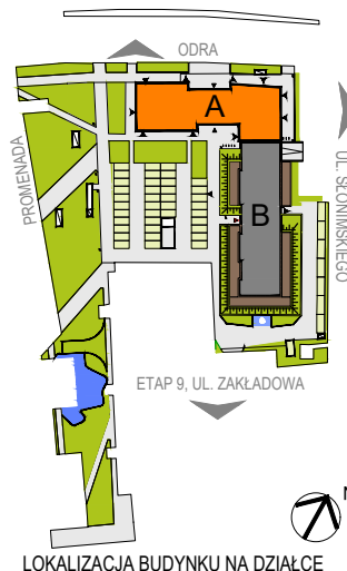
LOKALIZACJA BUDYNKU NA DZIAŁCE