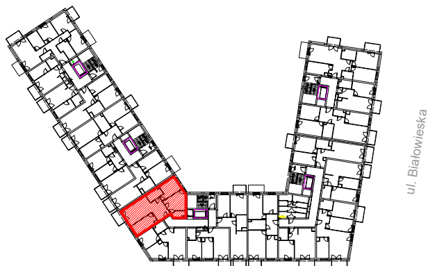
RZUT - I PIĘTRO