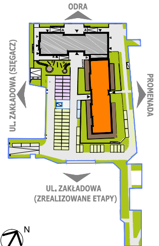
LOKALIZACJA BUDYNKU NA DZIAŁCE