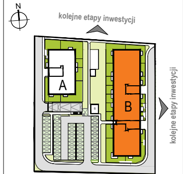
LOKALIZACJA BUDYNKU NA DZIAŁCE