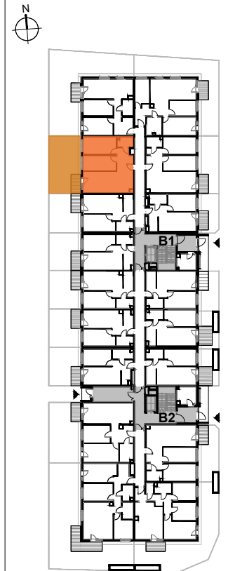
USYTUOWANIE MIESZKANIA NA KONDYGNACJI