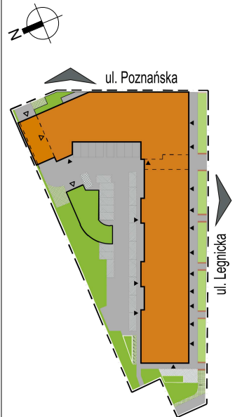
LOKALIZACJA BUDYNKU NA DZIAŁCE